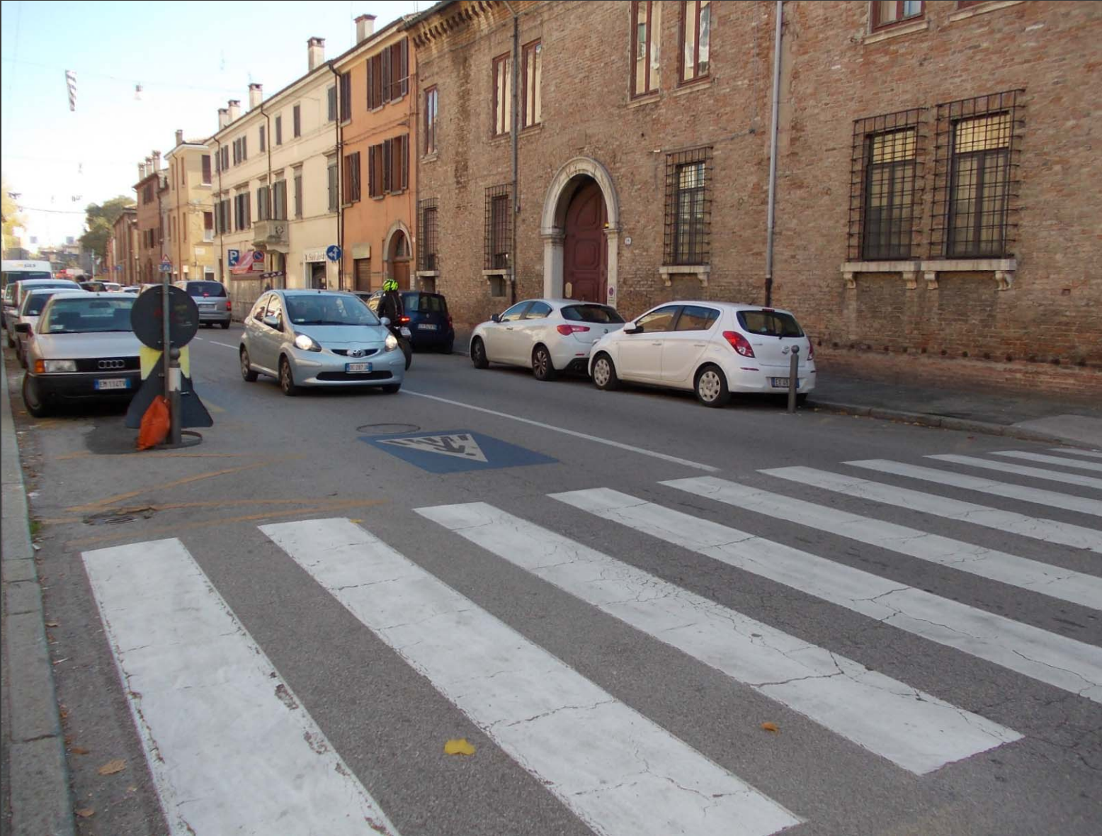
Corso Biagio Rossetti: messa in sicurezza attraversamento pedonale