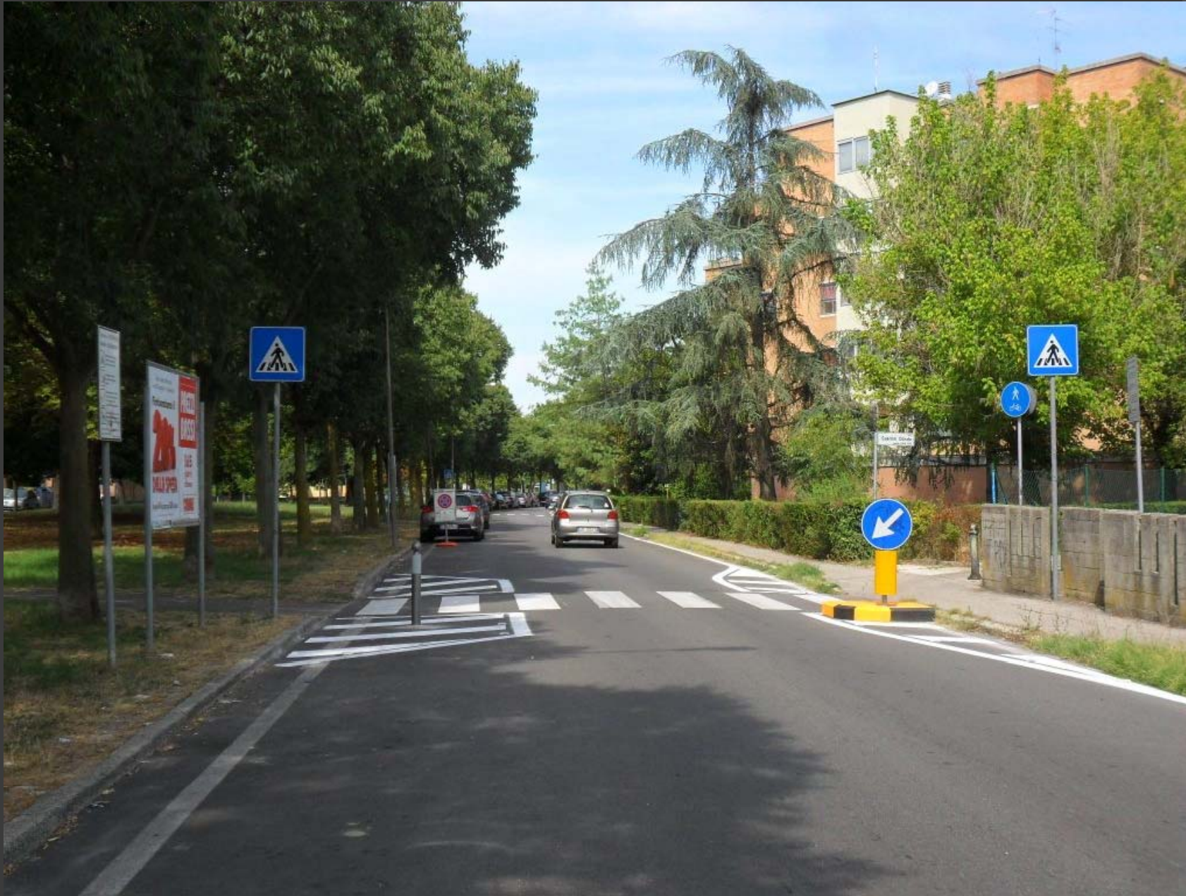
Viale Krasnodar: messa in sicurezza attraversamento pedonale