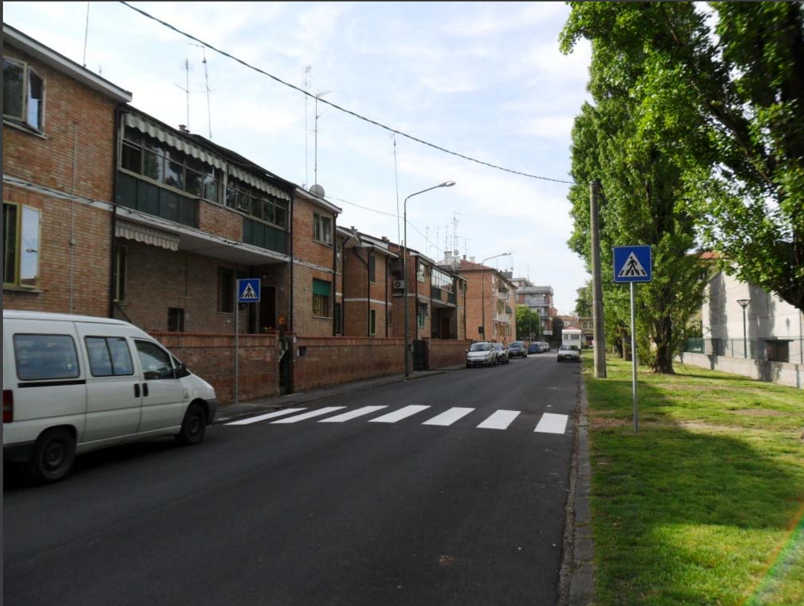
Via Fulvio Testi: nuovo attraversamento pedonale in corrispondenza del parco pubblico