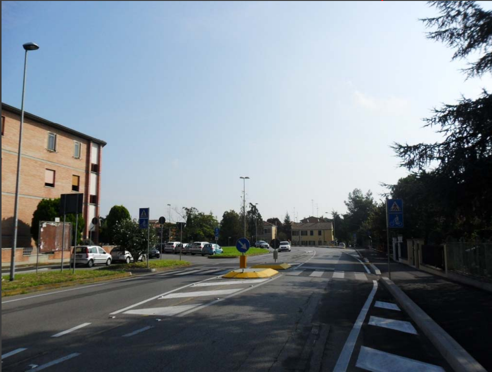
Via Giovanni XXIII: messa in sicurezza attraversamento pedonale