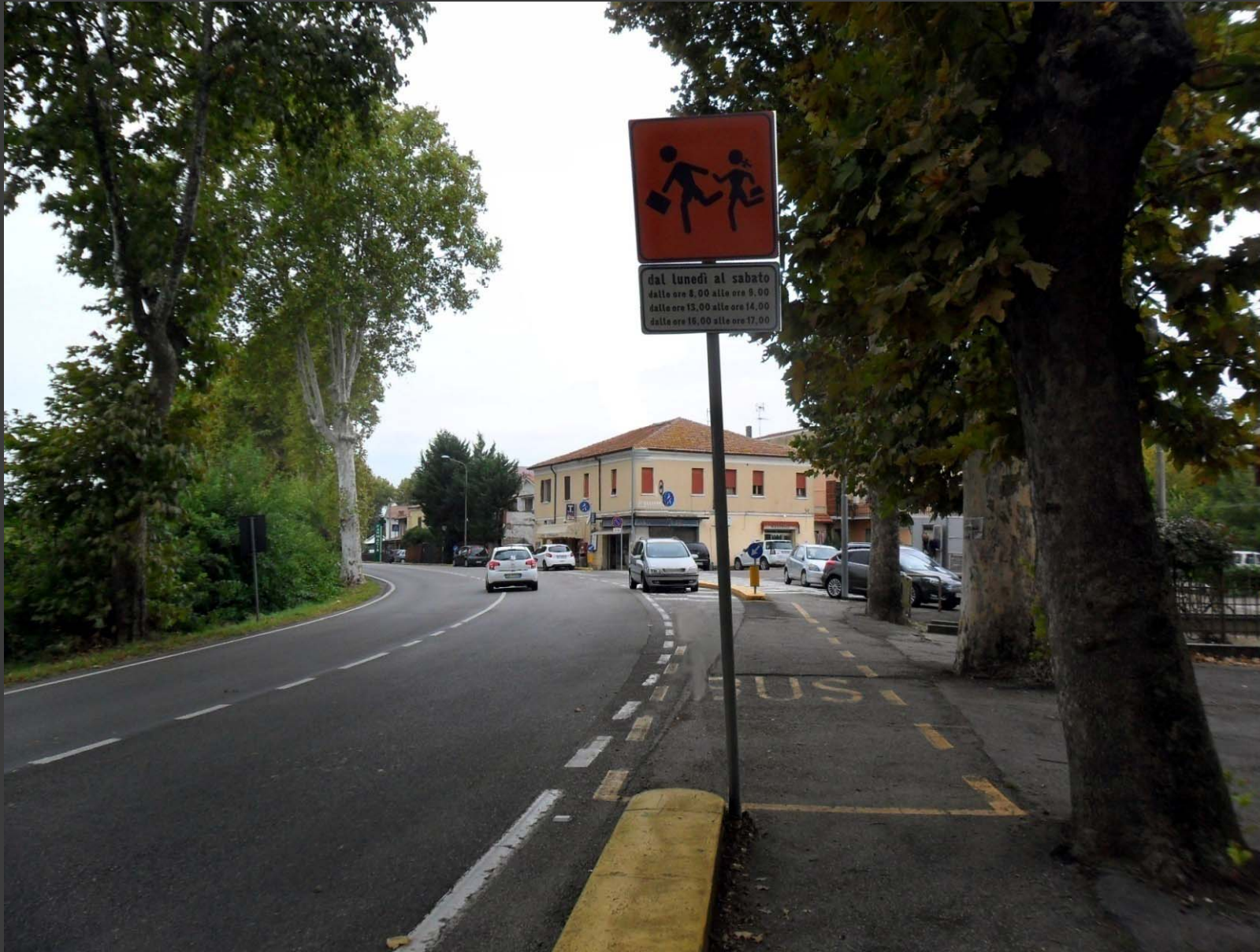
Via Comacchio (loc. Cona): adeguamento fermata scuolabus