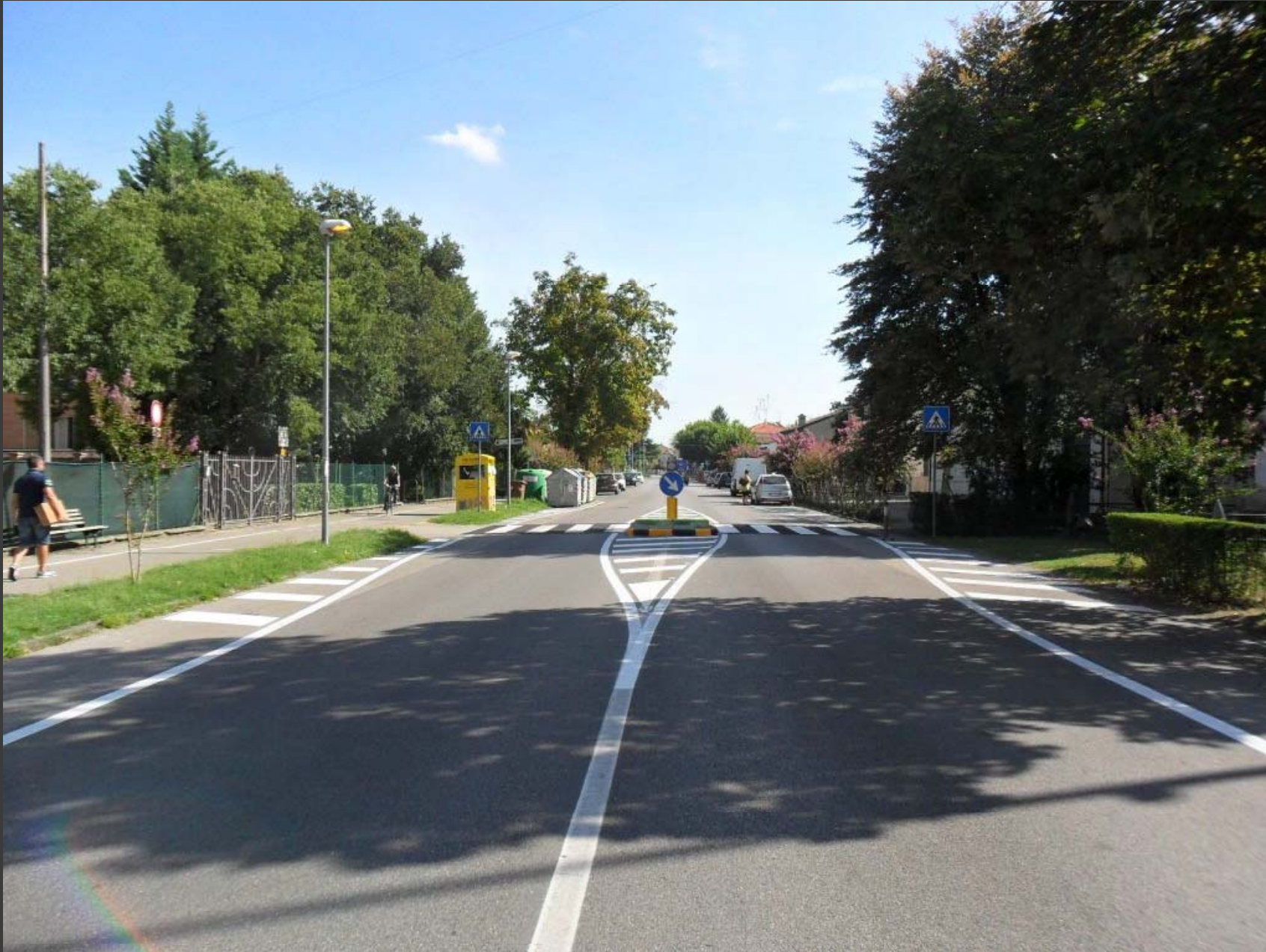
Via Chiesa (loc. San Martino): messa in sicurezza attraversamento pedonale fronte scuola e Chiesa