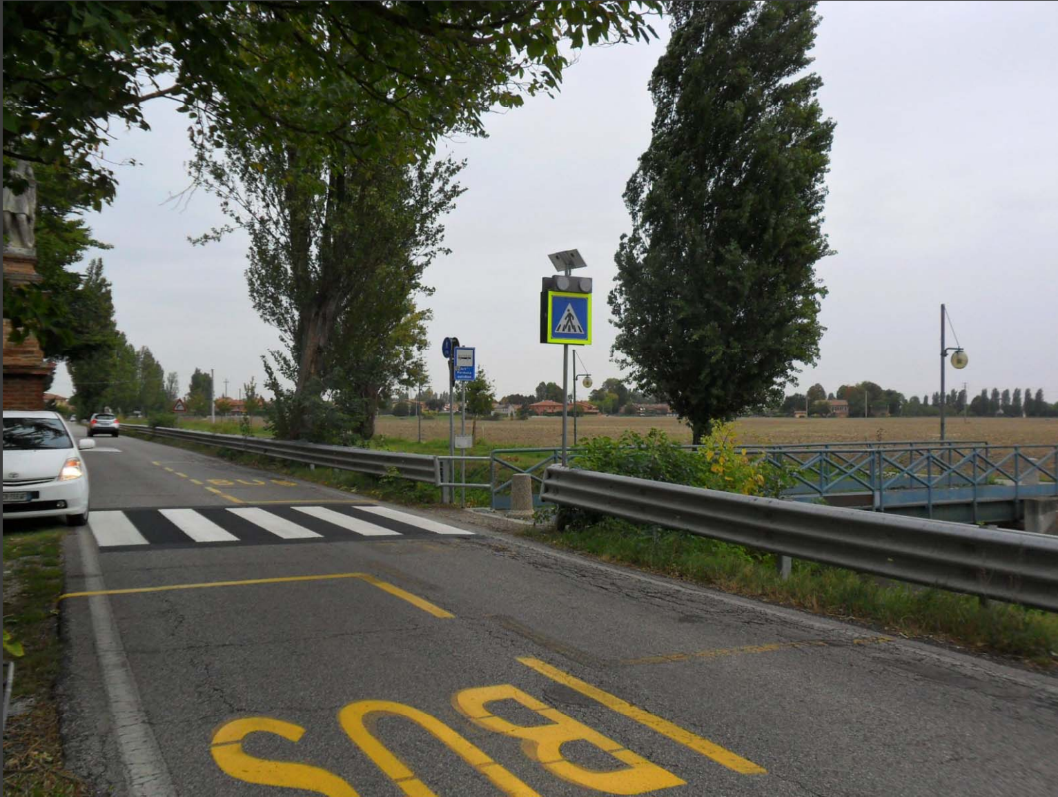
Via Pontegradella: messa in sicurezza attraversamento pedonale