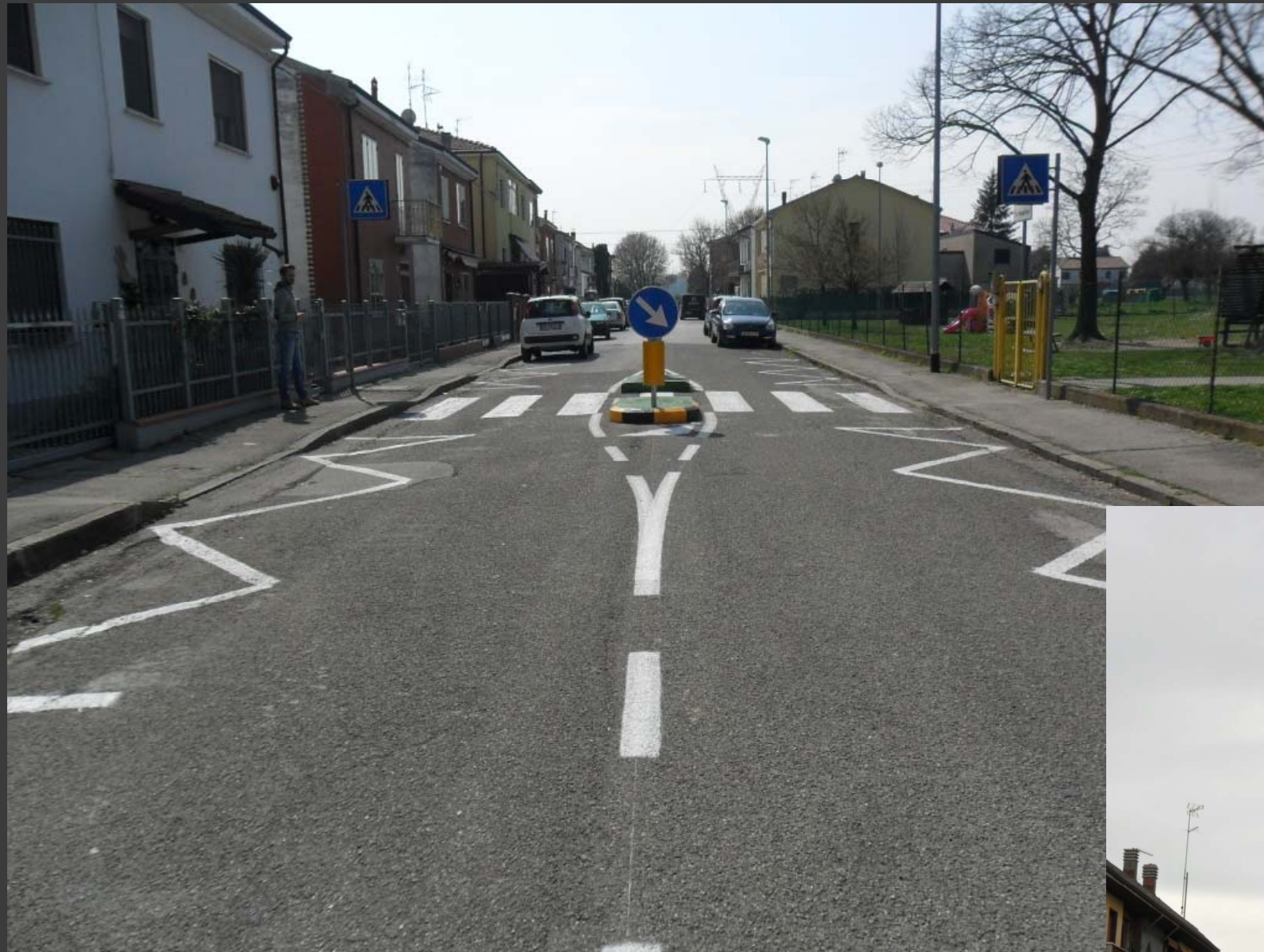
Via Manfredini (loc. Cassana): messa in sicurezza attraversamento pedonale fronte scuola materna