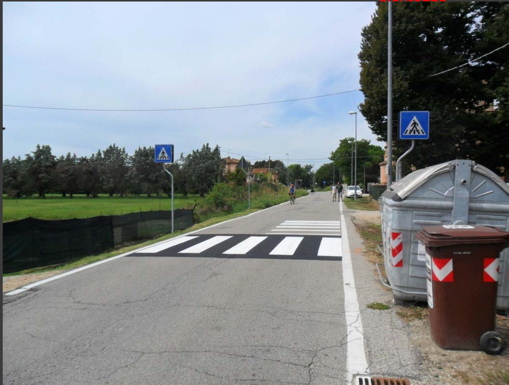
Via Massafiscaglia (loc. Contrapò): messa in sicurezza attraversamento pedonale