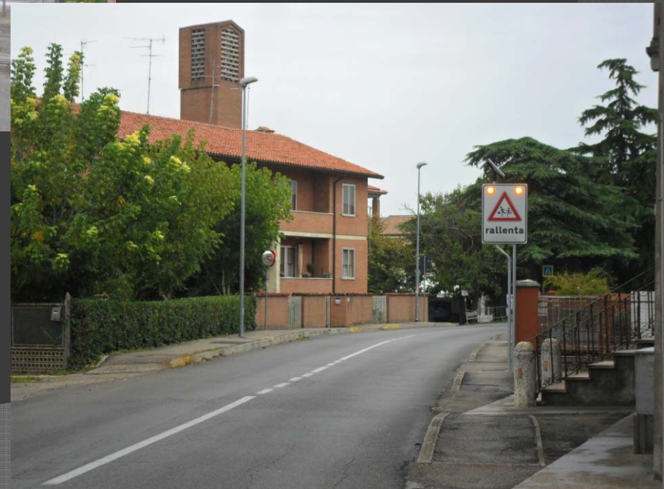
Via Briosi: messa in sicurezza attraversamento pedonale fronte Chiesa