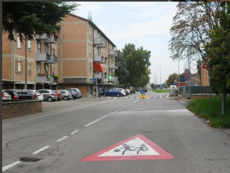
Via Bentivoglio: messa in sicurezza attraversamento pedonale fronte scuole