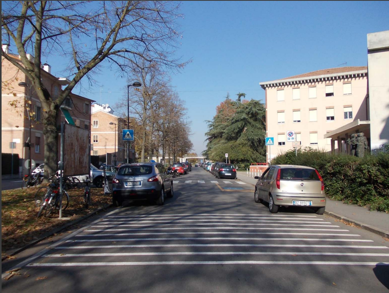
Via Azzo Novello: messa in sicurezza attraversamento pedonale