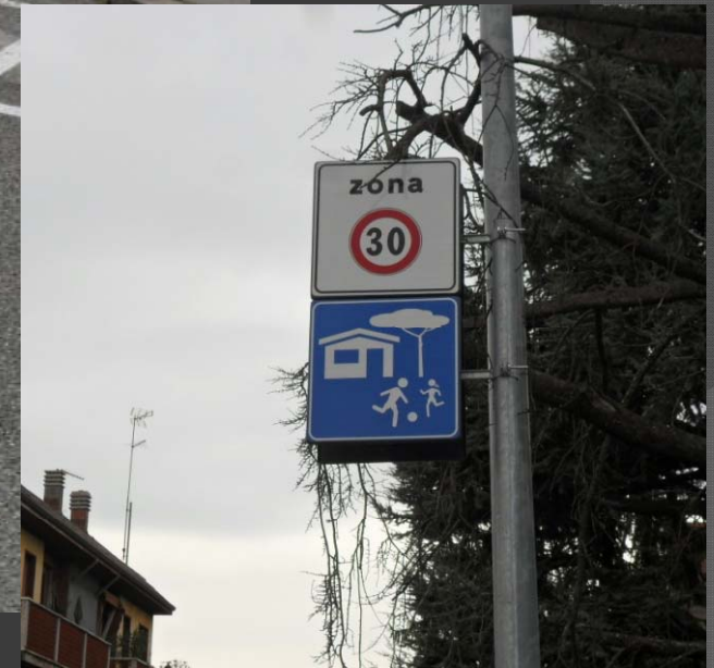
Istituzione zona 30 e residenziale in tutto il comparto