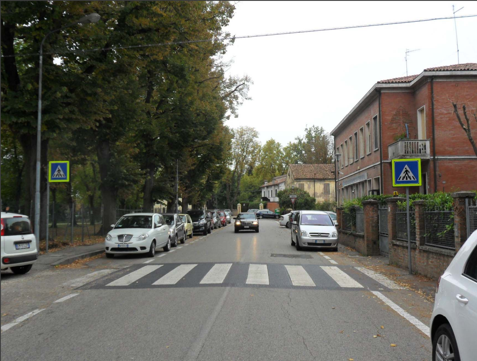
Via Rabbiosa (loc. Quartesana): messa in sicurezza attraversamento pedonale fronte scuole