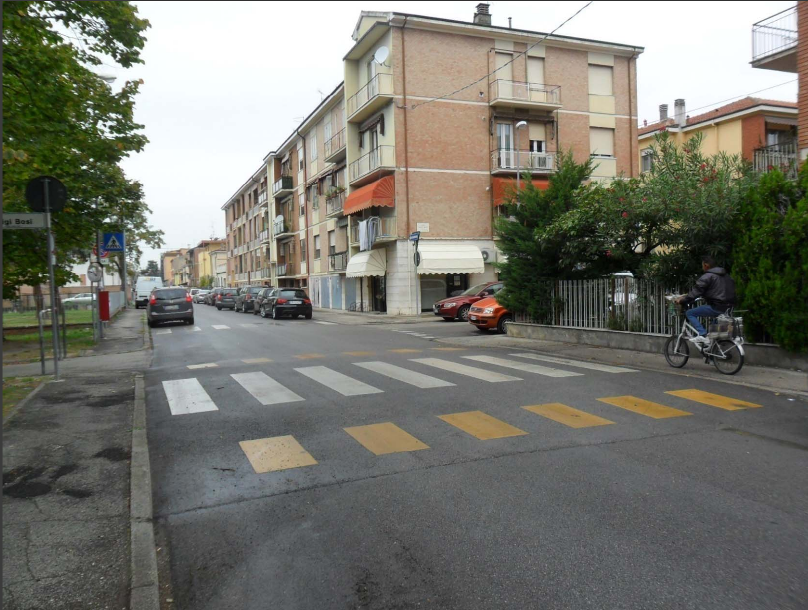
Via Grillenzoni: messa in sicurezza attraversamento pedonale