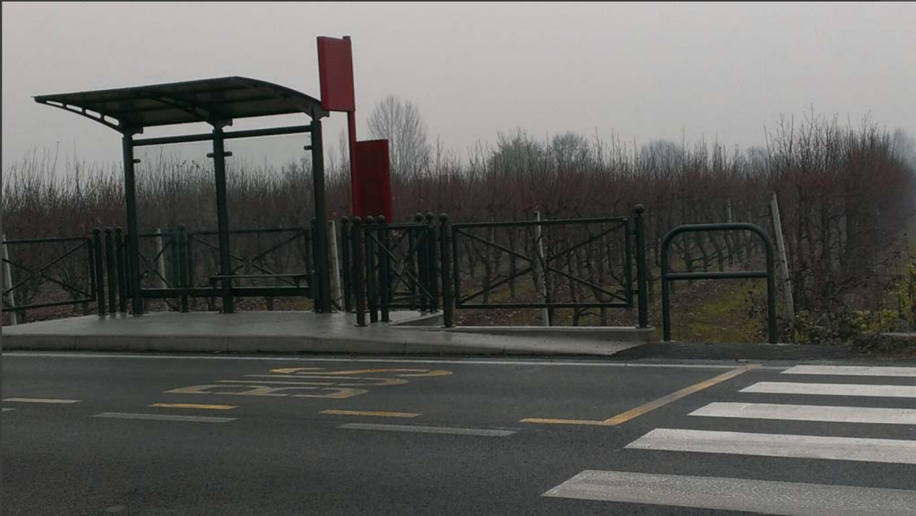
Via Comacchio (Città del Ragazzo): adeguamento fermata bus