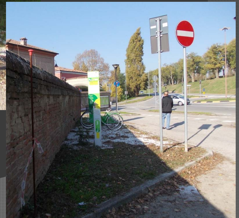
Via Rampari San Rocco: postazione Mi Muovo in Bici