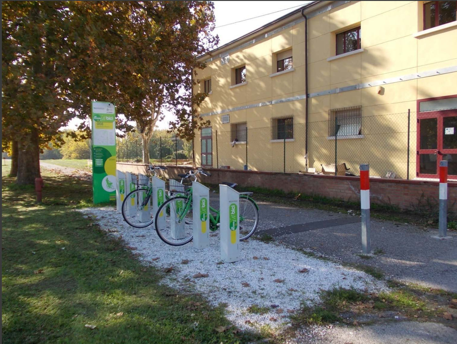
Via Saragat (Facoltà di Ingegneria): postazione Mi Muovo in Bici