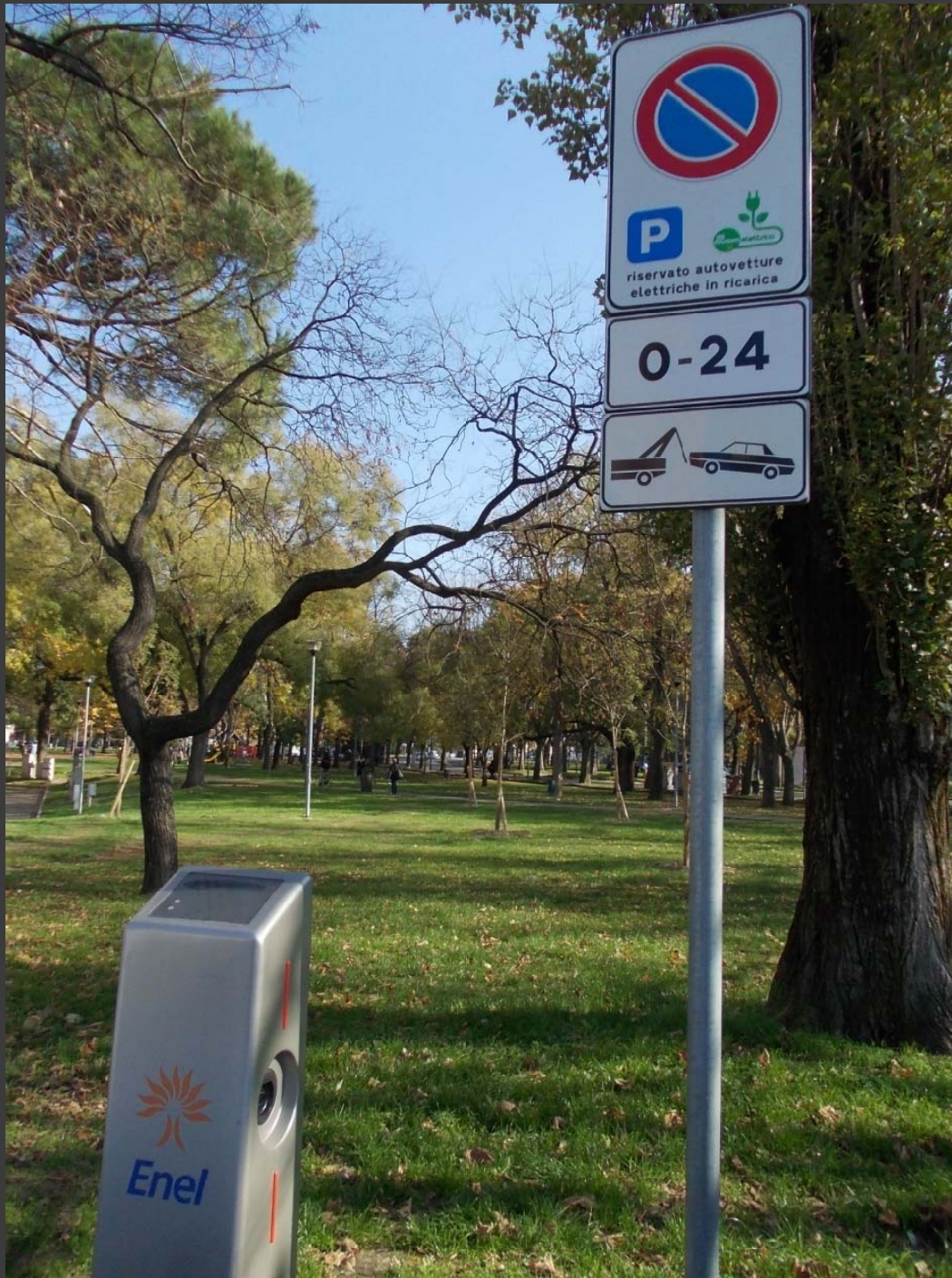
Via Felisatti: colonnina di ricarica veicoli elettrici