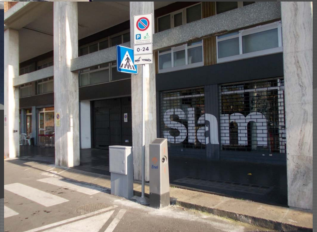
Via Kennedy: colonnina di ricarica veicoli elettrici