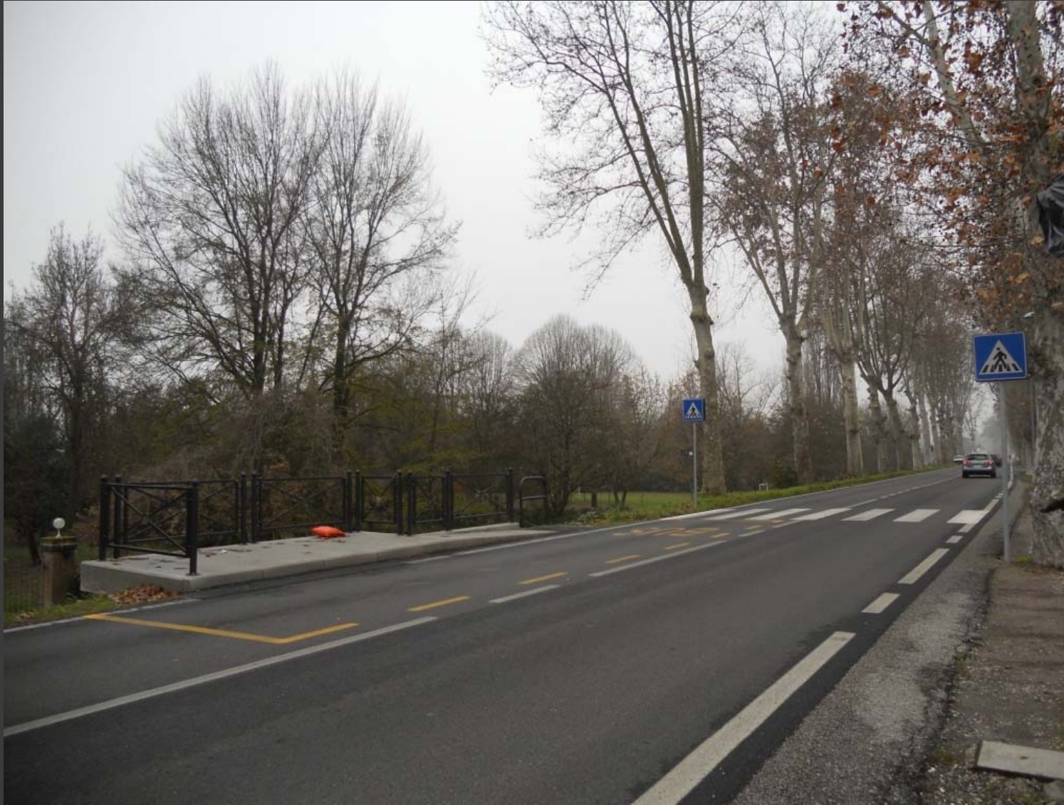
Via Comacchio (fermata quarto km): adeguamento fermata bus