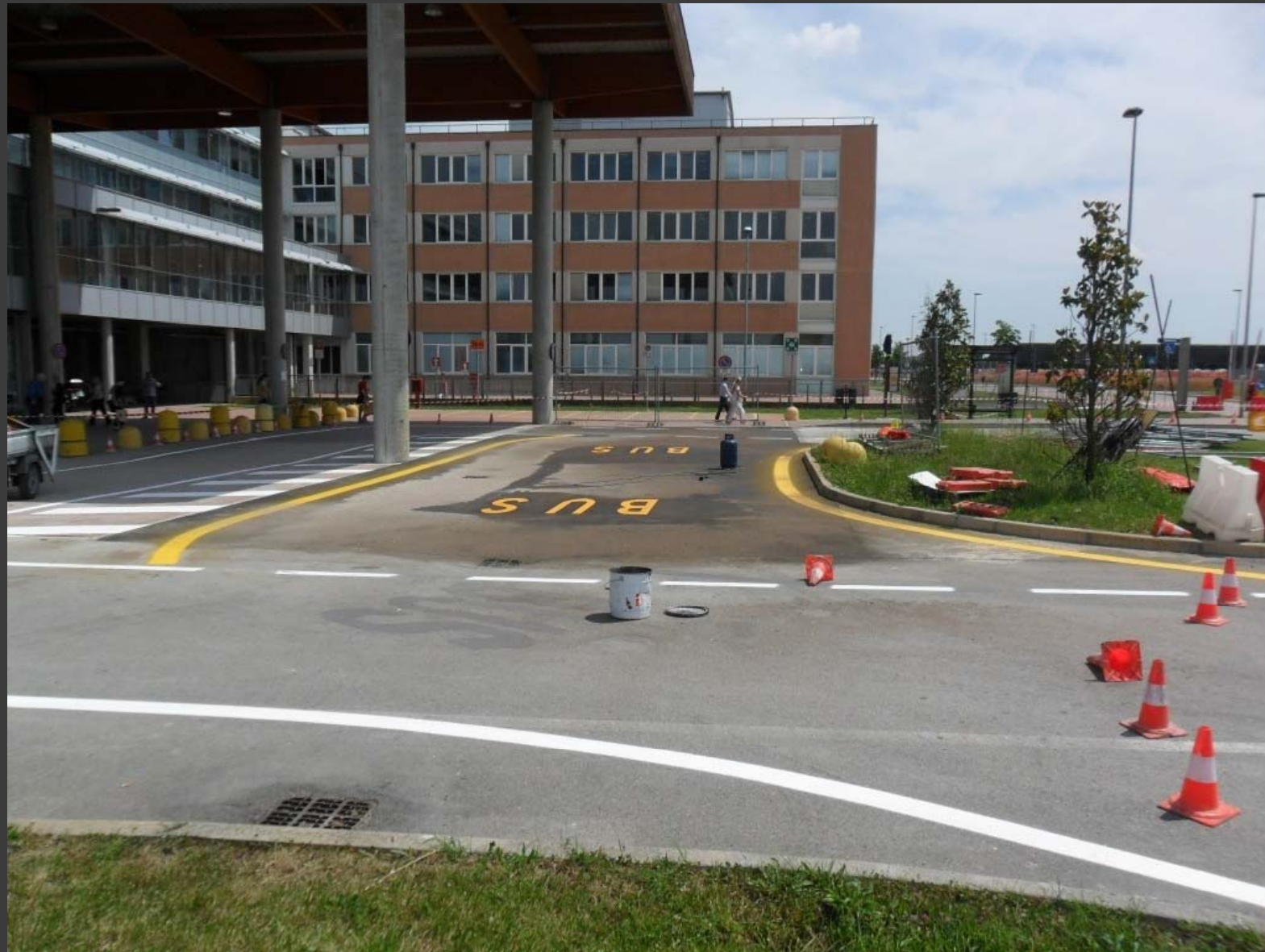
Ospedale di Cona: adeguamento fermata bus