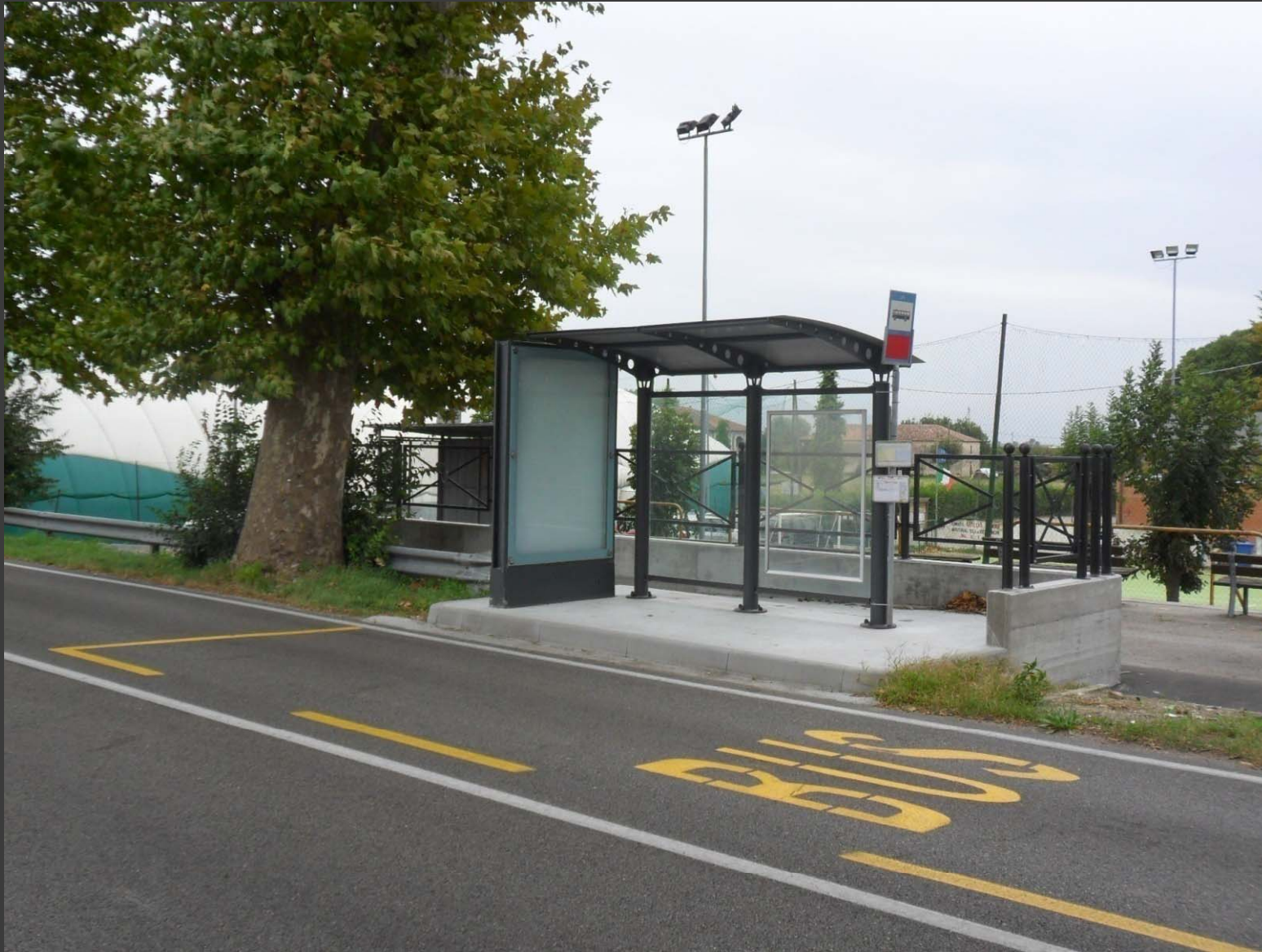
Via Comacchio (fermata Cocomaro di Cona): adeguamento fermata bus