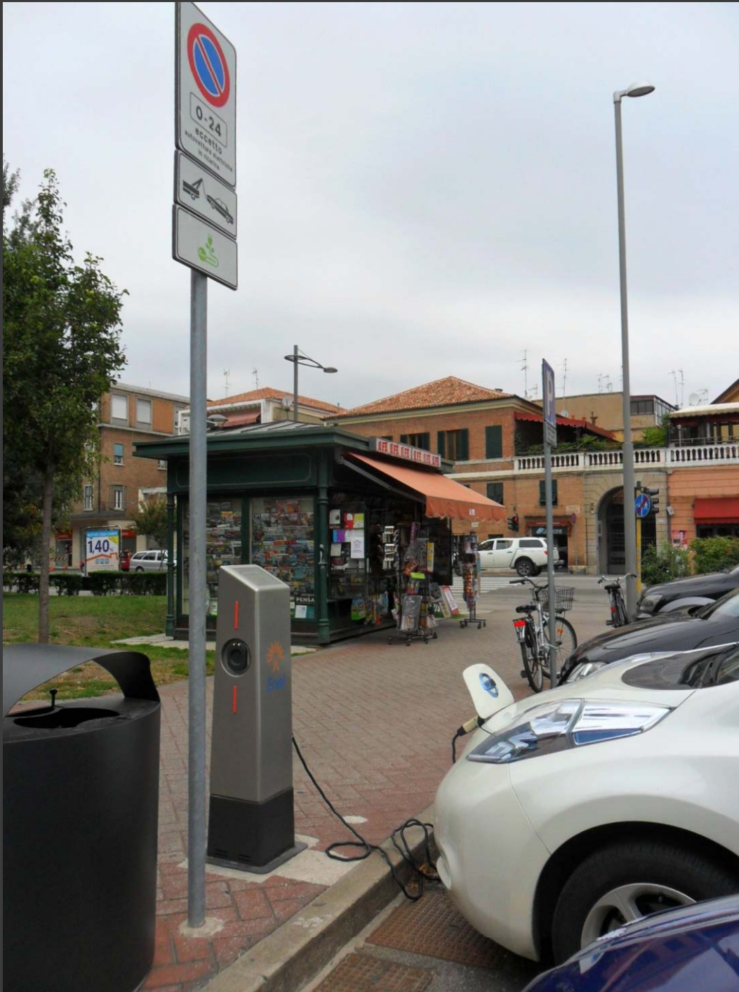
Largo Castello: colonnina di ricarica veicoli elettrici