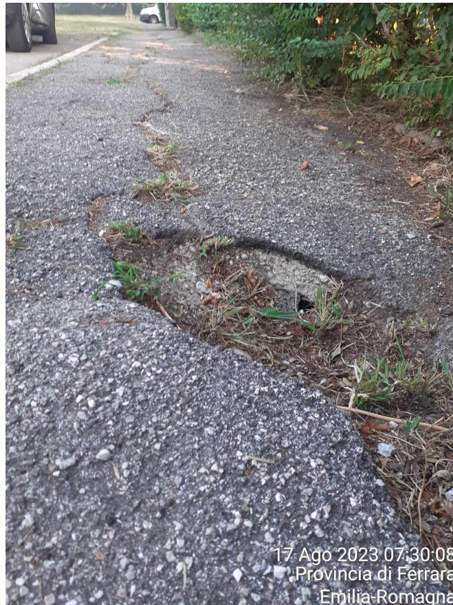
17 Ago 2023 07:30:08 Provincia di Ferrara Emilia-Romagna