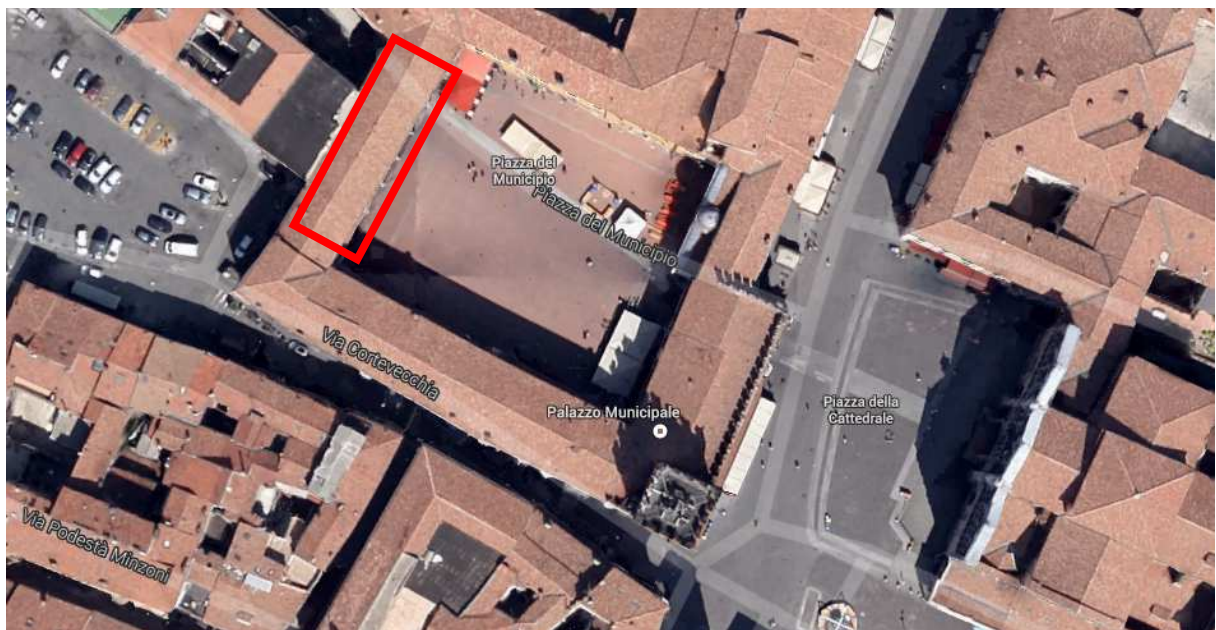
Figura 1 Inquadramento

Gli archi sono in cotto lavorato con cornici, lesene e torciglioni mentre le colonne sono di marmo; essi sono in buono stato di conservazione dal punto di vista strutturale, ma presentano notevoli depositi di polvere ed incrostazioni, degrado di tipo ambientale, nonché alcune vecchie stuccature mal realizzate con materiali incongrui.