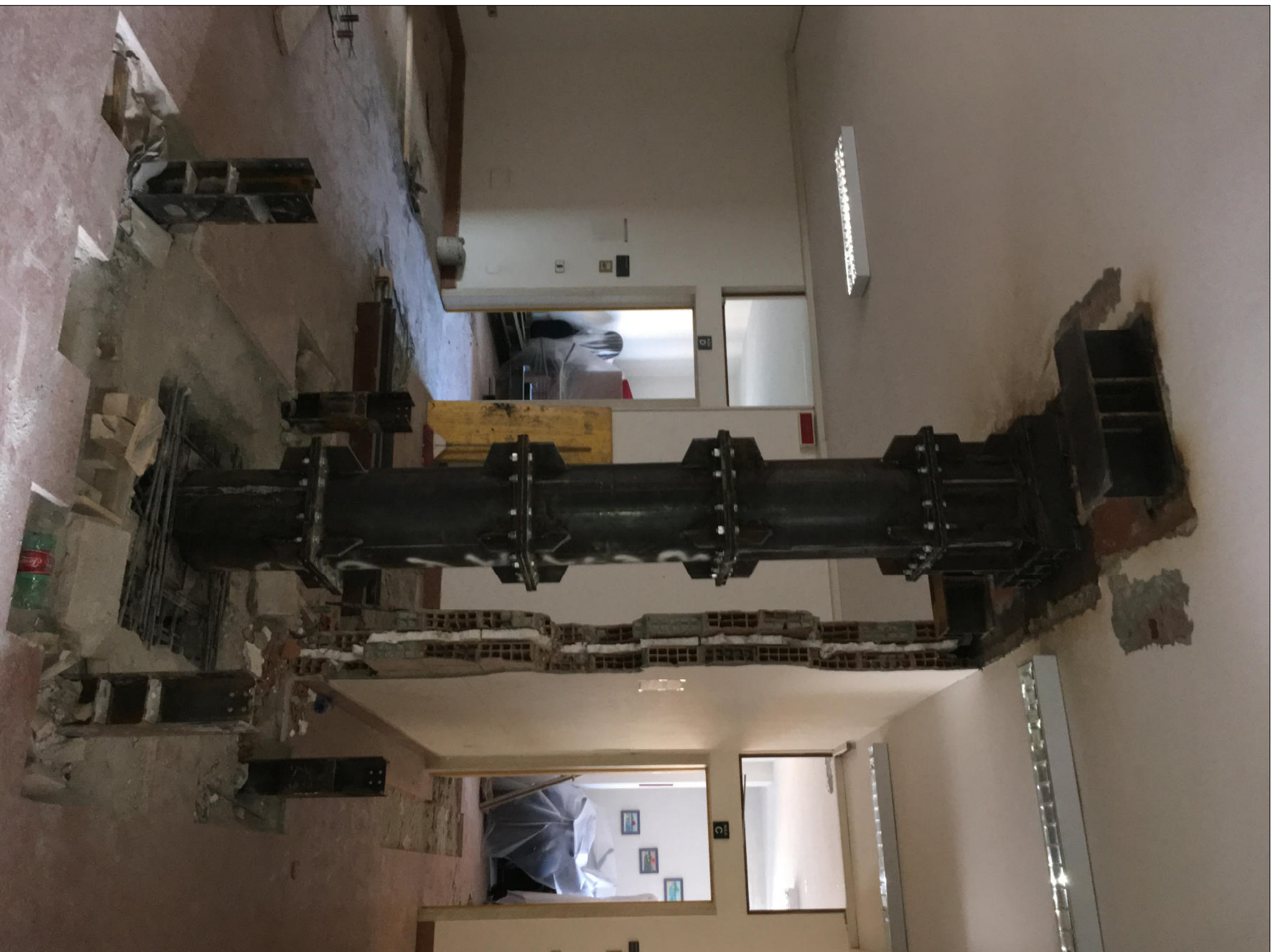
DETTAGLIO NUOVE COLONNE METALLICHE AL PIANO PRIMO DOPO SMONTAGGIO TRALICCI PROVVISORI