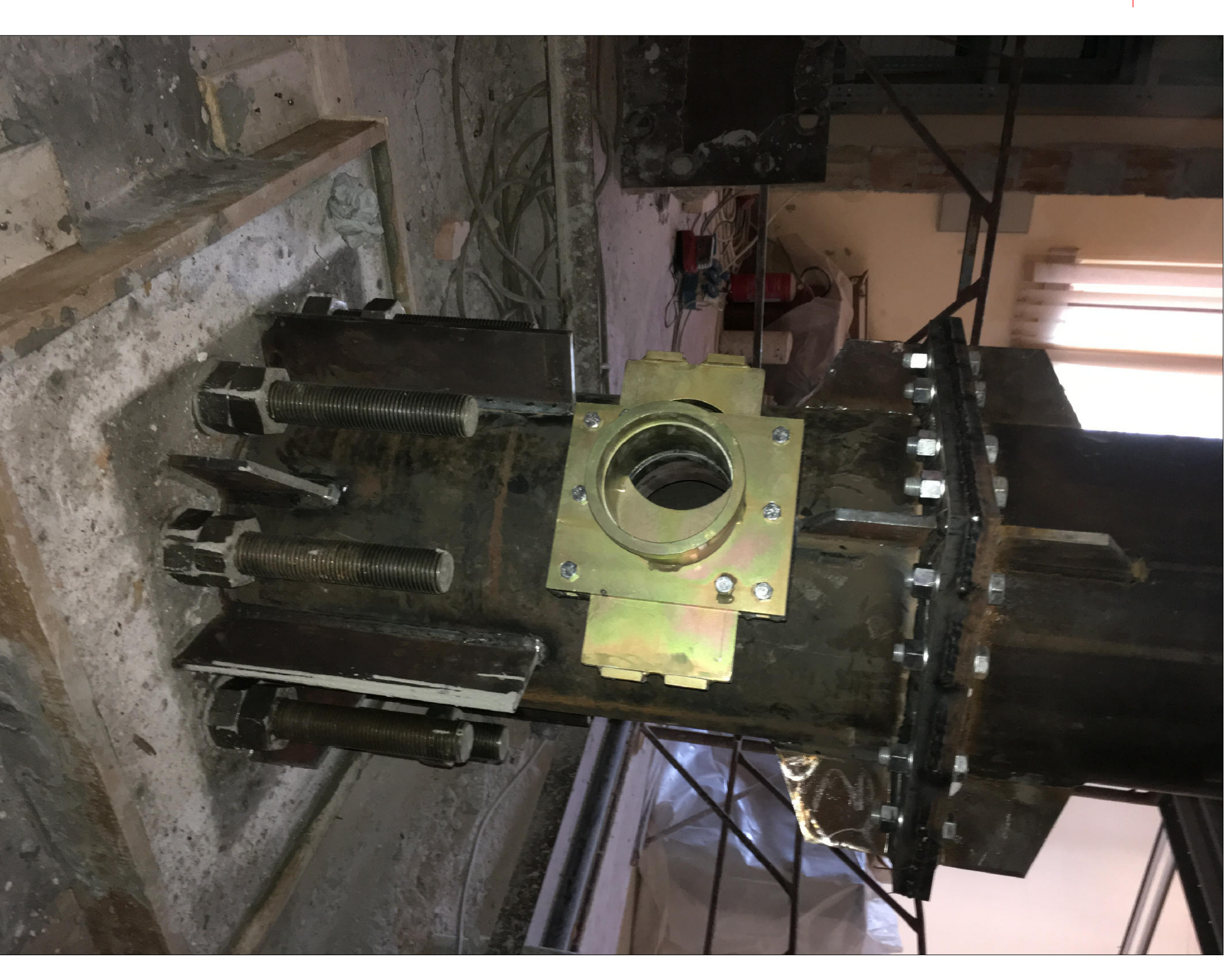
DETTAGLIO BOCCA DI GETTO TEMPORANEA UTILIZZATA PER IL RIPIEMIMENTO INTERNO DELLE NUOVE COLONNE CON CALCESTRUZZO (UNICA FASE)