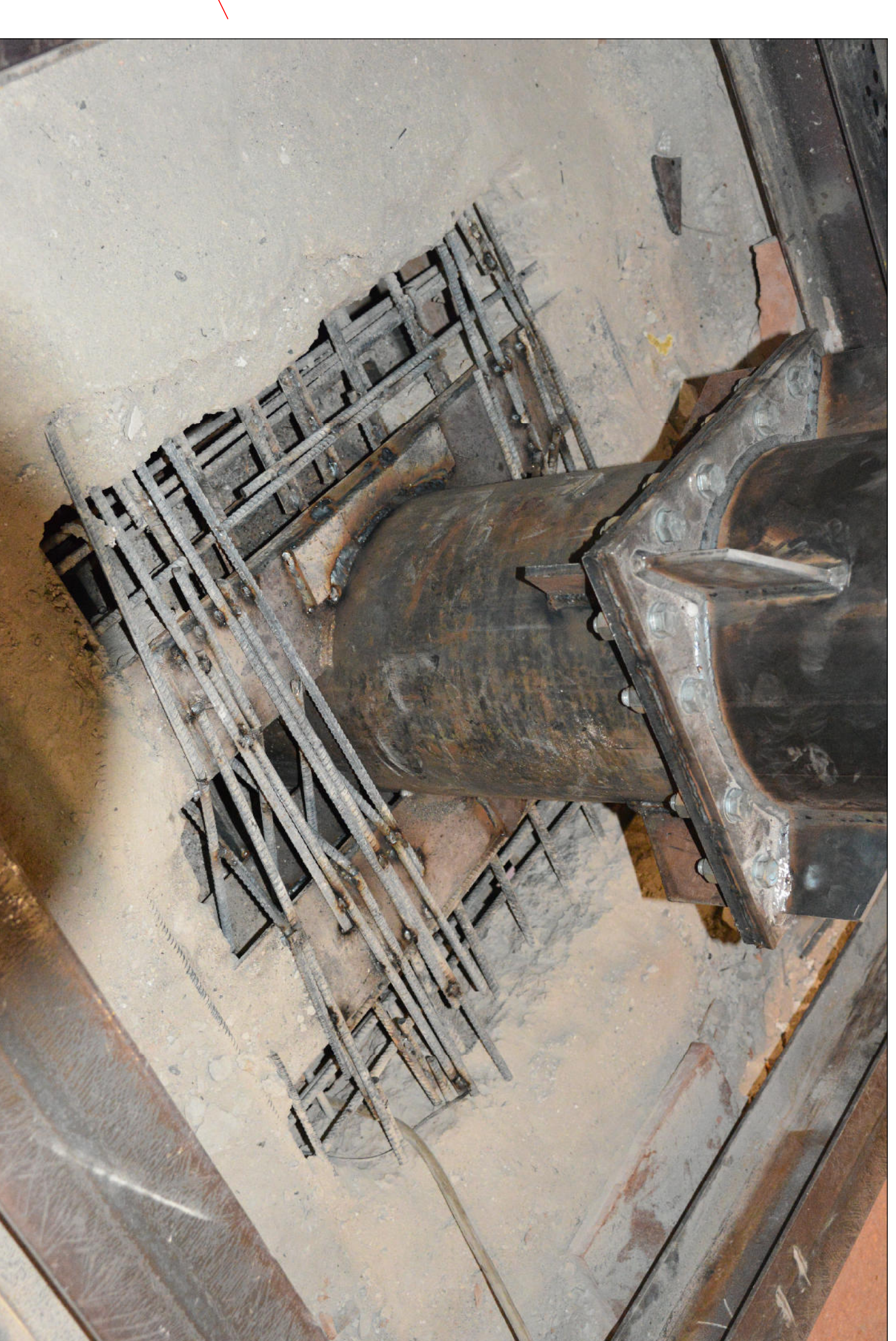
DETTAGLIO INTERVENTI DI RINFORZO DEI COLLEGAMENTI DELLE NUOVE COLONNE A LIVELLO DEL SOLAIO DI PIANO PRIMO