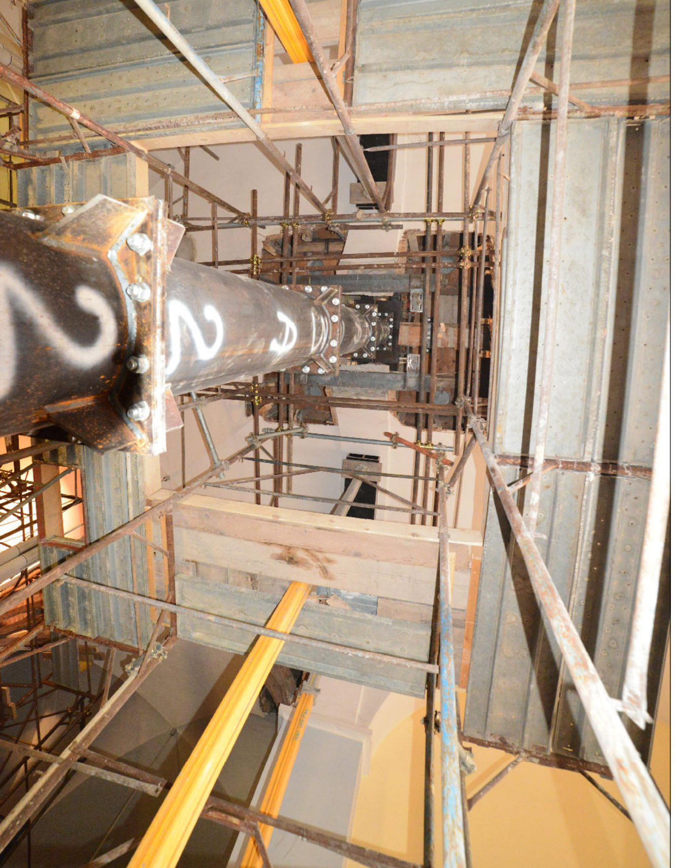
DETTAGLIO NUOVE COLONNE METALLICHE AL PIANO TERRA (VISTA DAL BASSO VERSO L' ALTO)