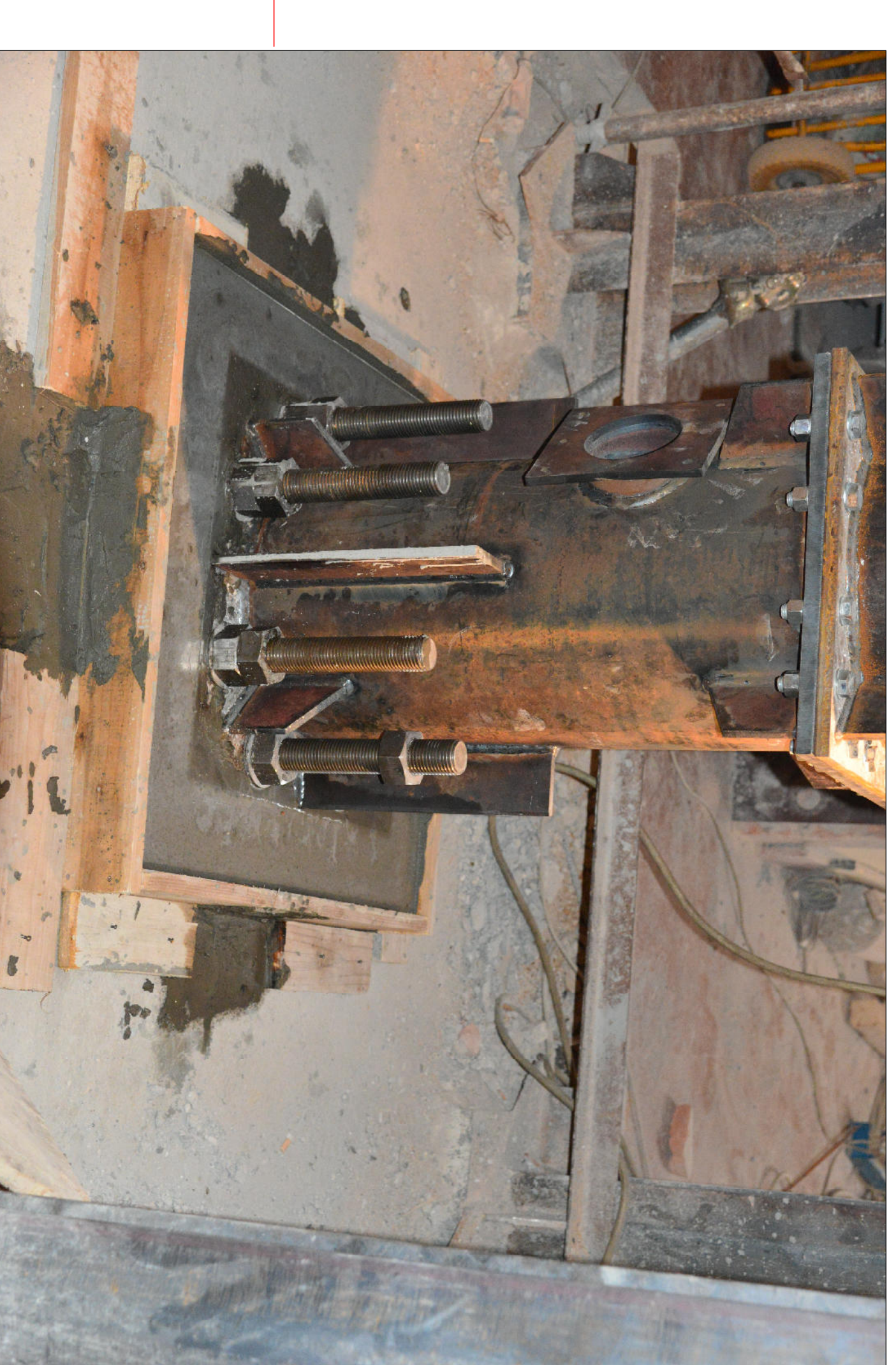
DETTAGLIO INGHISSAGGIO DEFINITIVO ALLA BASE DELLE NUOVE COLONNE