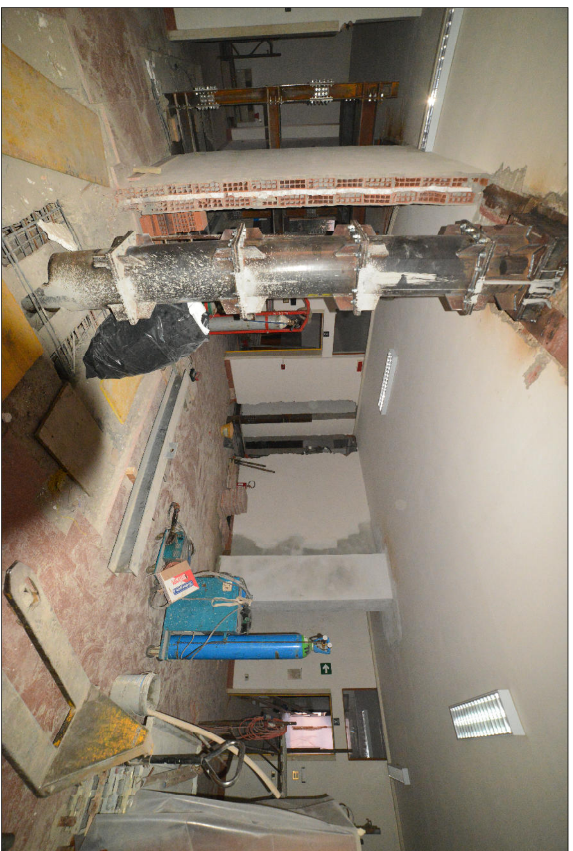
DETTAGLIO NUOVE COLONNE METALLICHE AL PIANO PRIMO DOPO SMONTAGGIO TRALICCI PROVVISORI