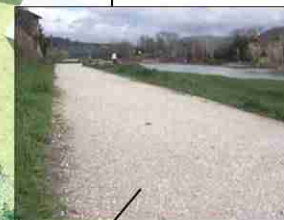
stabilizzato in ghiaia per percorso esterno pedonale