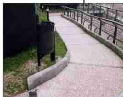
stabilizzato in cls della piazza sopraelevata