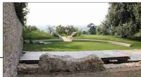
esempio di seduta e camminamento con struttura in legno