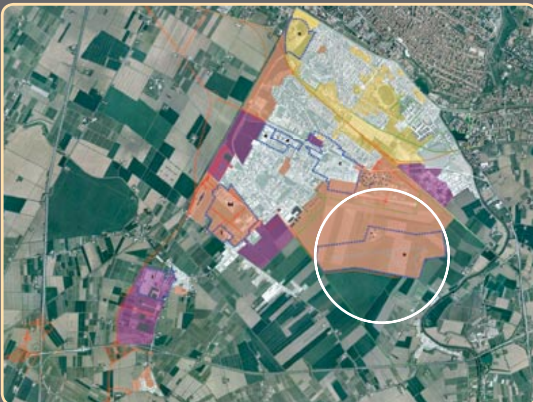
Nella foto aerea, evidenziata con diversi colori, l'area interessata dalla variante. Nel cerchio la collocazione della nuova pista aeroportuale