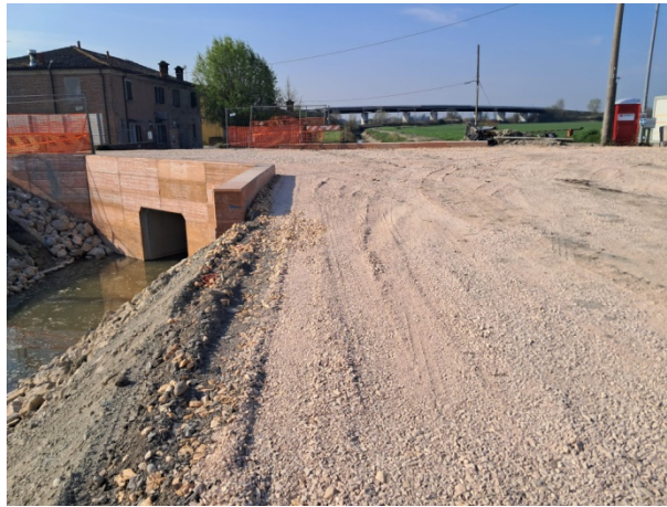
Realizzazione nuovo sottofondo stradale