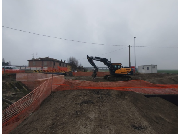
Riempimento degli scavi