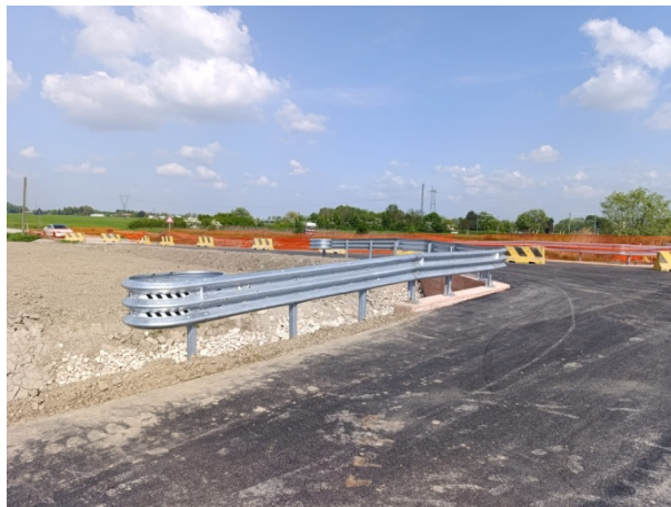
Installazione barriere di sicurezza