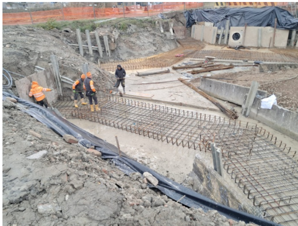
Realizzazione platea di fondazione