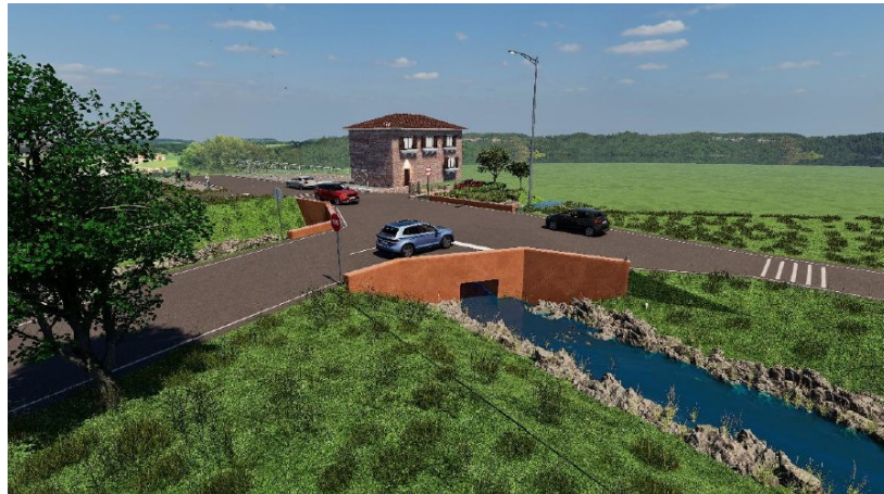
Figura 2: Foto inserimento Stato di progetto

A completare l'intervento verranno si dovranno realizzare i muri andatori, uno per ogni punto di imbocco del canale, per un totale di tre. Si tratta di pareti rettilinee in elevazione dello spessore strutturale di 40 cm armati su entrambe le facce delle pareti.