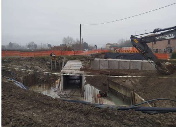
Posa scatolari prefabbricati