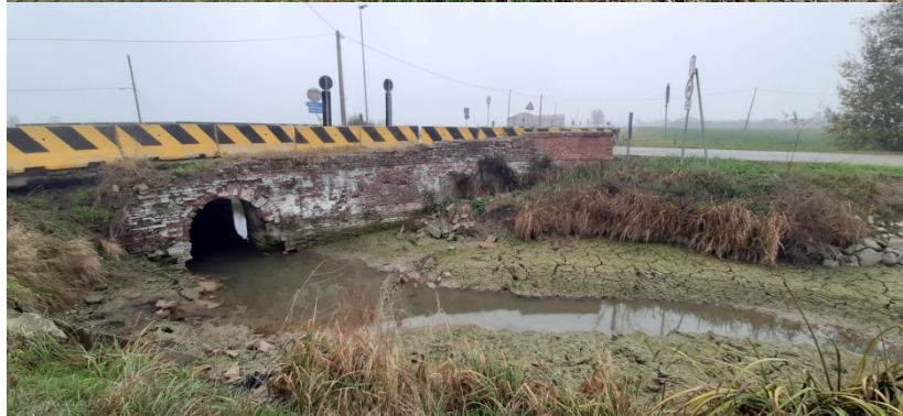
Stato ante lavori