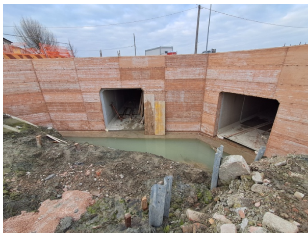
Carpenterie muri andatori