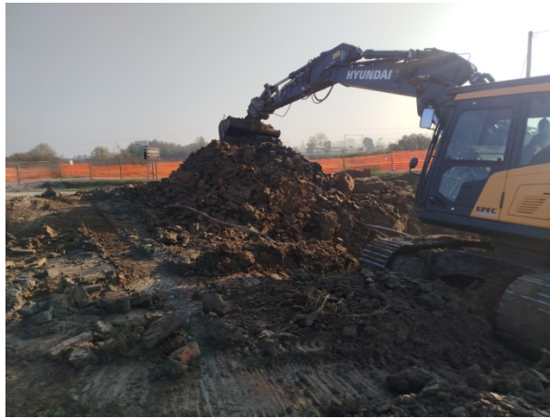
Scavi e demolizioni