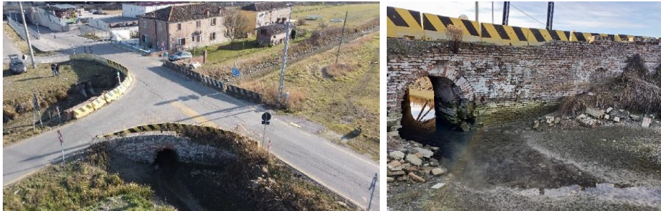
Figura 1: Stato di fatto

Titolo del progetto: LAVORI DI MANUTENZIONE STRAORDINARIA DEL PONTE UICATO IN VIA PELOSA INT. VIA IMPERIALE (CIA 80/2024– CUP B77H24003040006)