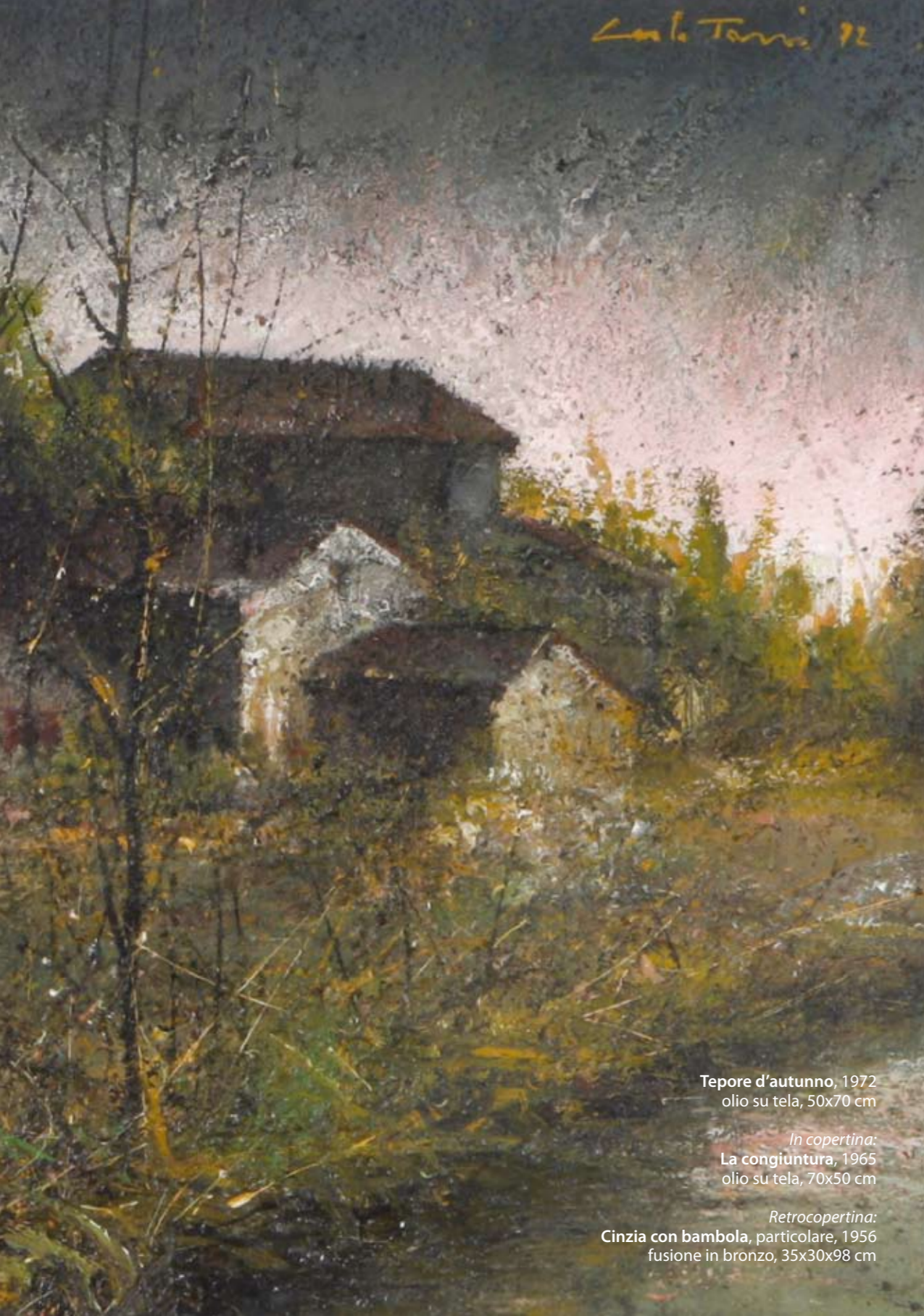
Tepore d'autunno, 1972 olio su tela, 50x70 cm