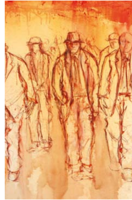
Il corteo , particolare, 1982 tecnica mista su tela, 60x120 cm