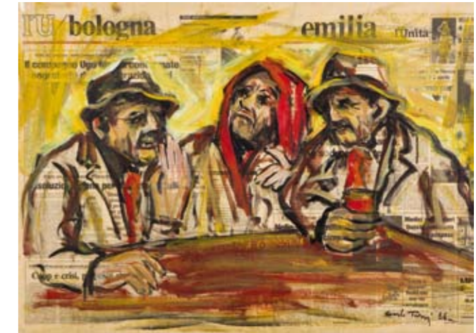
Compagni , 1986 olio su carta di giornale, 60x80 cm