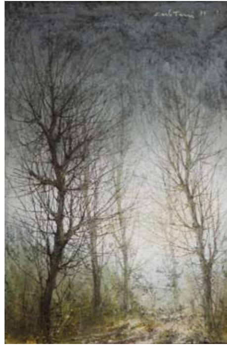
Nebbia , 1977 olio su tela, 60x40 cm