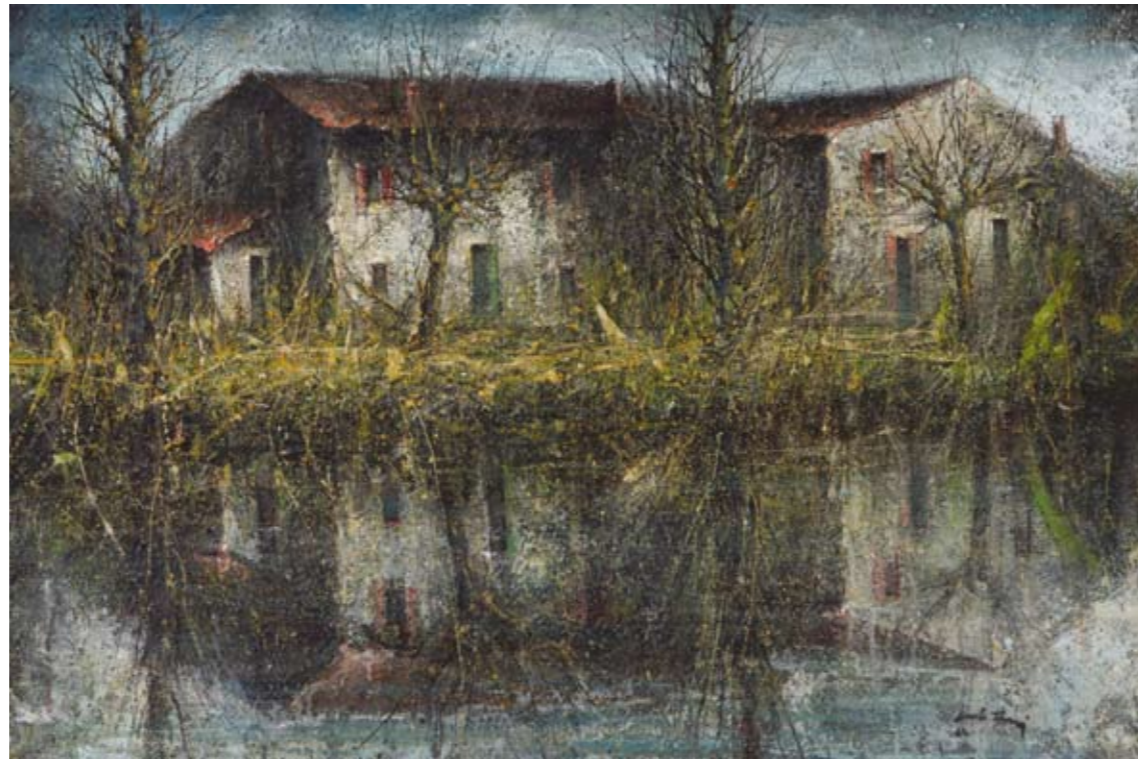
Il macero , 1982 olio su tela, 80x120 cm

Il suo studio, situato nel cuore di Bondeno è ancora oggi costellato di ritagli di fotografie, prese da giornali. Frammenti visivi che ci aiutano a conoscere le scelte, le attese e le speranze vissute dall'uomo Carlo Tassi. Le sue stanze da lavoro sono tappezzate di riferimenti sociali e politici in un grande guazzabuglio di lingue, di proclami e di idee. Una babilonia del terzo millennio, che lui però leggeva in modo univoco e chiaro.