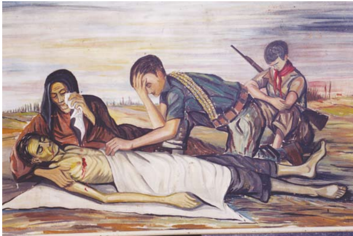
Pietà partigiana , 1954 olio su masonite, 100x150 cm

Casa di Ludovico Ariosto e il Museo del Risorgimento e della Resistenza sono due realtà museali che ben poco hanno in comune. La prima è l'ultima residenza di Ariosto – quella nella quale prepara la terza edizione del suo Orlando Furioso aggiungendovi 6 canti – e ospita alcuni cimeli riferiti alle testimonianze evocative proposte nei Centenari ariosteschi del 1875 e nel 1933; il secondo è il museo storico di Ferrara per eccellenza che narra, attraverso documenti e manufatti vari (dalle divise militari alle armi, alle bandiere ecc.), momenti cruciali della storia della nostra nazione.