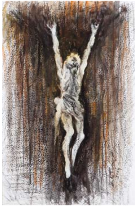
Cristo , 2004 olio su carta, 62x43 cm