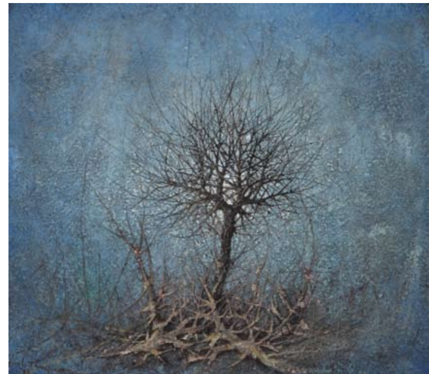
Inquinamento 04 , 1987 olio su tela, 86x76 cm

di dipingere direttamente sulle pagine del quotidiano L'Unità . Schiaccia i piani, toglie profondità. La società viene rappresentata senza intellettualismi, sintetizzata in poche figure, grafiche, leggere, essenziali, dai contorni neri e netti.