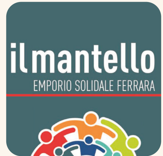
Il Mantello emporio solidale Ferrara