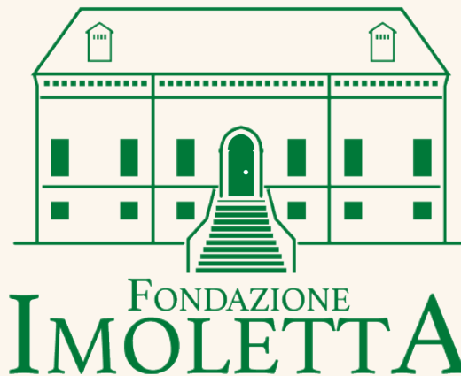
Fondazione Imoletta E.T.S.