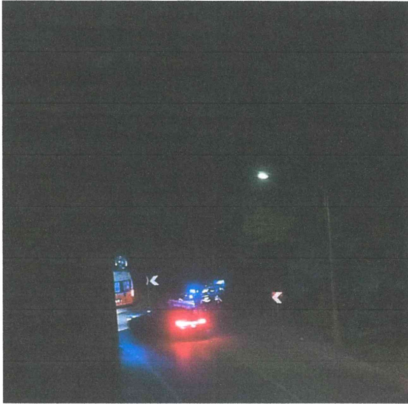
29 Agosto 2020 via Braghini verso via Vicenza