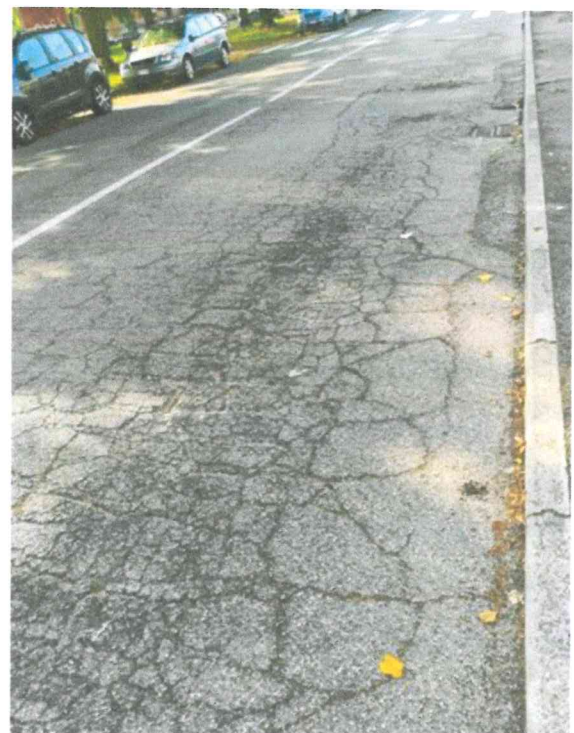
Via Braghini - stato del manto stradale e marciapiedi 12/10/18