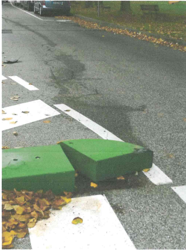
Pezzo dell'isola pedonale divelto dall'incidente del 31/10/2019 ( rimasto tal quale)