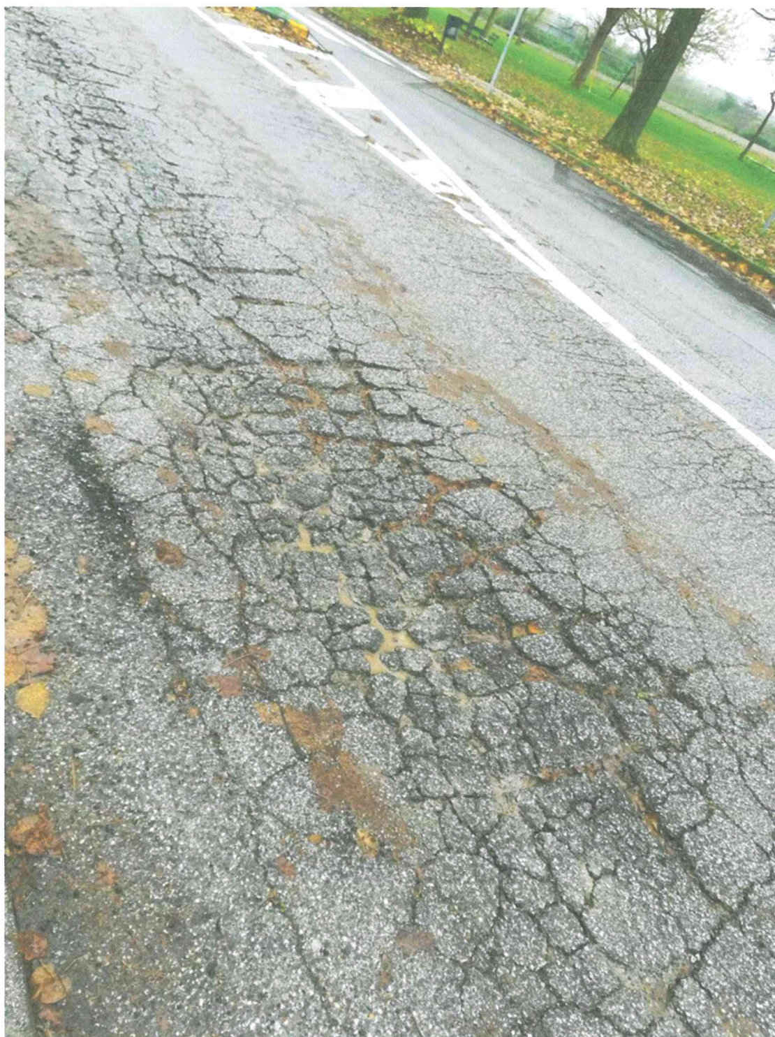
Manto stradale via Braghini 2020