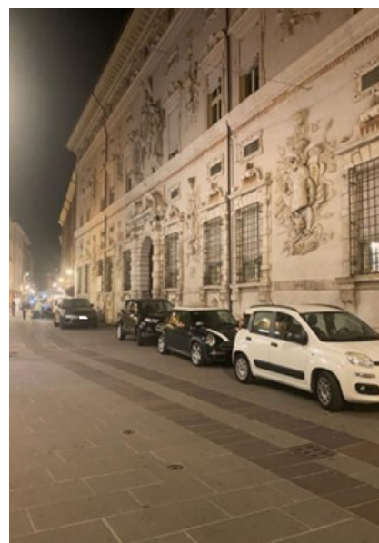
Figura 2- via Garibaldi 28/09/2023 ore 20.30