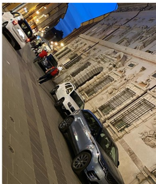
Figura 3-via Garibaldi 05/10/2023 ore 19.10