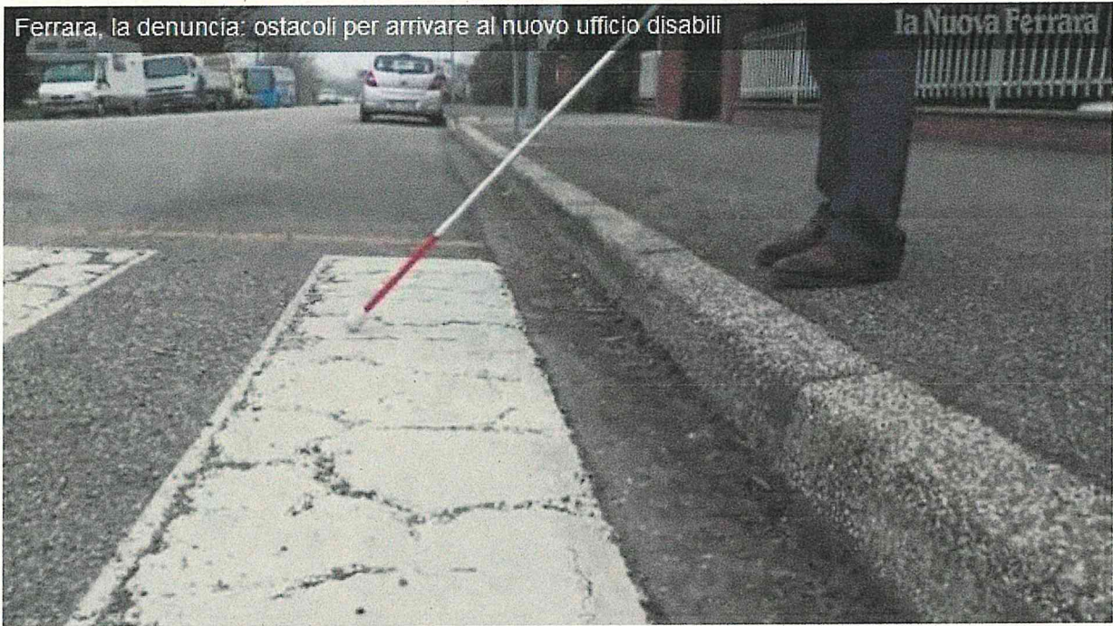
Ferrara, la denuncia: ostacoli per arrivare al nuovo ufficio disabili